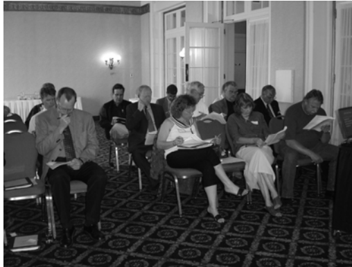
Annual General Meeting